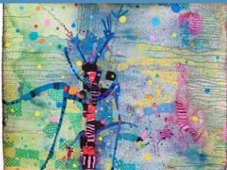
Huguette Caland, Rossinante Under Cover VII (Dragonfly), 2011

Treffen: Mittwoch, 25. März, 10.30 Uhr, Begegnungsstätte, Martinistr. 33